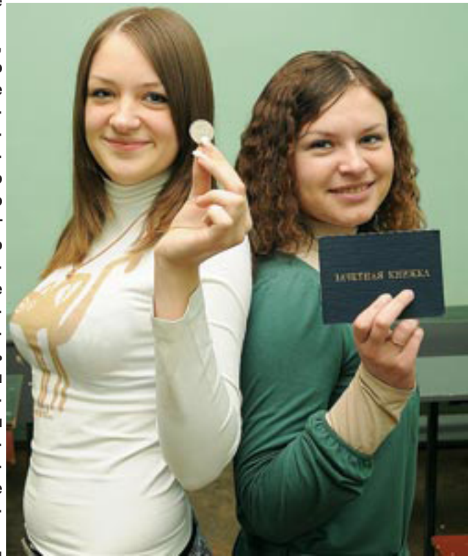
У студентов различных стран есть свои суеверия