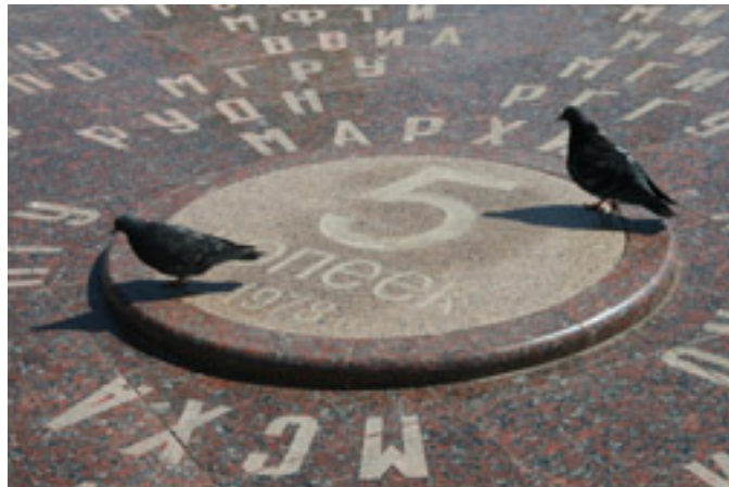
Памятник копейке как атрибуту студенческого суеверия вдобавок не стирать одежду, в ко-

Также прочно закоренилась в студенческой среде традиция не мыться перед экзаменом. Считается, что вода смывает со студента все знания, полученные во время ночного сидения перед учебниками. То же самое касается отказа от бритья, состригания волос и ногтей. Здесь есть один положительный момент - преподаватель, посмотрев на небритого студента, подумает, что студент, поглощенный изучением любимого предмета, даже побриться перед экзаменом не успел, и сделает ему снисхождение. Так же «немытость» студента сокращает время его ответа на экзамене — примите это к сведению те, кто не любит долго беседовать с преподавателем, погружаясь в неизведанные глубины посредственно известного предмета. Некоторые рекомендуют