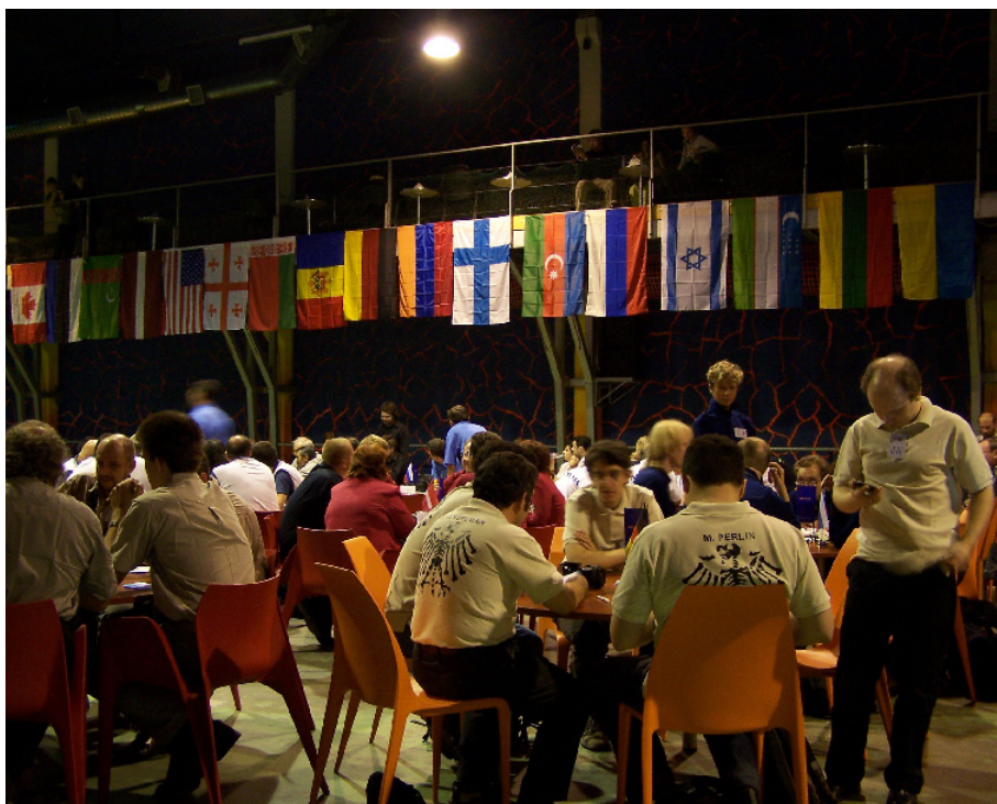
Раз в год проводится марафон (24 часа игры в ЧГК)

Человек, как правило, попадает туда случайно, через своих друзей, знакомых, увиденное объявление, школьный или университетский клуб. Кстати, в БГУ существует Клуб ин-